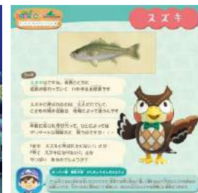
オリジナル解説パネル

場 所 : 「アクアミュージアム」、「ドルフィン ファンタジー」 「うみファーム」、「ふれあいラグーン」 ※生物の体調等により、展示が変更となる場合がございます。