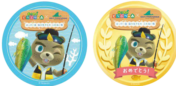
ジャスティンのオリジナルステッカー

また、同エリアでは、3分間でどれだけ多くのサカナを釣れるかを競う「ジャスティンの釣り大会」を1日2回開催いたします。参加者にはジャスティンがデザインされたオリジナルステッカー、大会の優勝者には特別デザインのオリジナルステッカーがプレゼントされます。