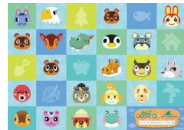
ゴール記念ステッカー

スタンプラリーブック販売場所 : 「アクアミュージアム」1階チケット売場 「アクアミュージアム」4階インフォメーション 「ふれあいラグーン」プログラム受付