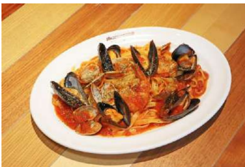
「ムールガイのペスカトーレ」 料 金：1,890円