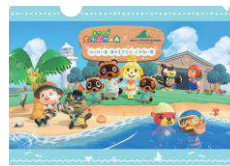
クリアファイル 330円