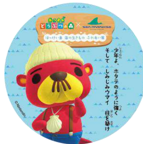
ラコスケのオリジナルステッカー