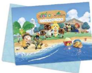
スタンプラリーブック

本企画のサカナや海の幸が展示されている4つの水族館を巡るスタンプラリーを開催いたします。水族館各所には「あつまれ どうぶつの森」に登場する住民のイラストが描かれたスタンプ台が14箇所設置されています。14種すべてのスタンプを集めてゴールをすると、ゴール記念のオリジナルステッカーをプレゼントいたします。また、スタンプラリーブック（別途有料）には水族館のマップや展示されているサカナや海の幸のチェックリストが記載されており、ガイドブックとしてもご利用いただけます。