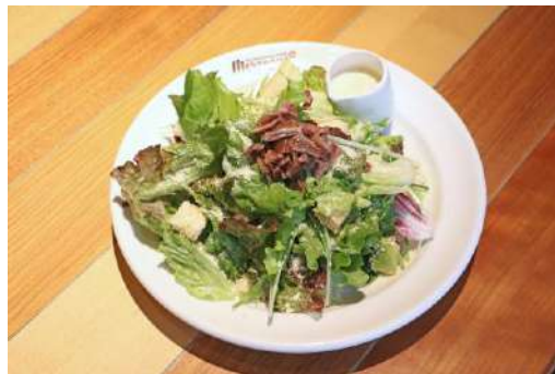
「アンチョビのシーザーサラダ」 料 金：1,290円