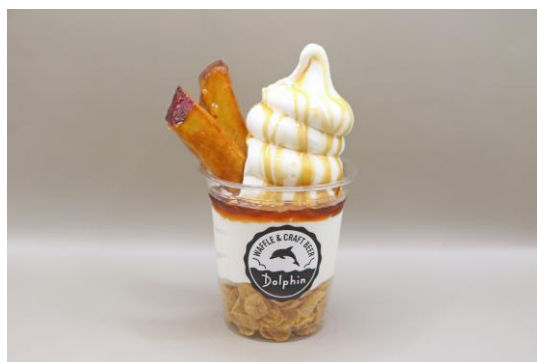
「芋っ子サンデー」 料金：600円 場所：ドルフィン