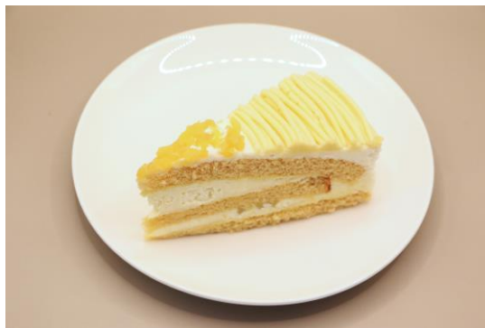
「マロンケーキ」 料金：900円 場所：しらうみ食堂