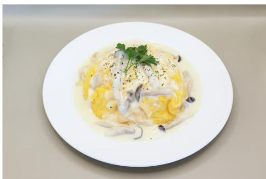
「きのこクリームオムライス」 料金：1,380円 場所：マンジャーレ

島内のレストランや軽飲食店舗では、食欲の秋にぴったりなメニューをご用意いたします。秋の味覚のひとつである、きのこをたっぷりと使用した「きのこクリームオムライス」や、上品な甘さを味わえる「マロンケーキ」など、メインのお食事からスイーツまで取り揃えます。