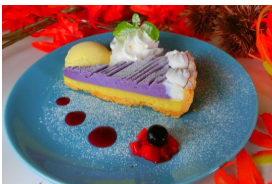
「紫芋とさつま芋のタルト (ドリンク付き)」 料金：880円 場所：ブーズカフェ