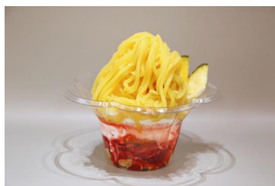
「オータムサンデー」 料金：700円 場所：シーパラダイス食品館