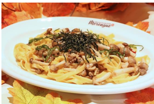
「豚肉としめじの和風パスタ」 料金：1,590円 場所：ハワイアンカフェ & レストラン メレンゲ