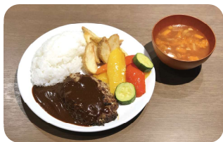
いのししハンバーグプレート 1,200円(税込)

Vol.13では「レストラン ロス クエストス デル マール」の おすすめメニューを紹介!