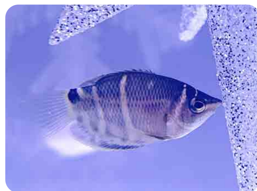
チョコレートグラミー

茶色いボディに、ミルクのように見える白いラインがチョコレートを連想させる「チョコレートグラミー」と、情熱的なキスをするような行動を見せる「キッシンググラミー」の2種を展示します。可愛らしい2種類の魚たちとホットでロマンティックな雰囲気をお楽しみください!