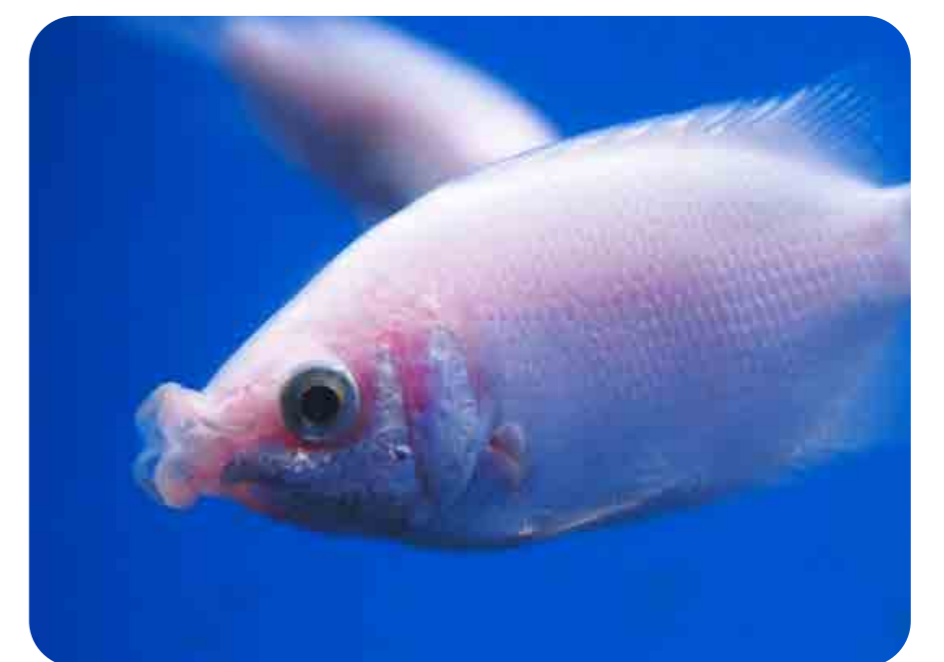
キッシンググラミー