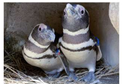
巣穴で卵を守るペアの様子

春が近づき、「うみがたり」のマゼランペンギンは新しい命のための準備を始めています。先月には巣穴を快適な空間にするため、地面を掘って土台を作成、巣材のワラを選び、各々が巣穴をリノベーション。時には、他の巣穴に入っているワラを自分の巣穴に運び込むペンギンも見られました! 堂々とした足取りでワラを巣穴に運ぶ姿は見ていて可愛らしく、したたかでもあります。いつもは自然な繁殖活動を見守るスタッフも、奪われすぎてワラが少なくなってしまう巣穴には、盗まれないようこっそりとワラを足してあげることも。現在は、快適空間を作り上げたペアのペンギンが寄り添って巣穴に入っている様子をご覧いただけます。